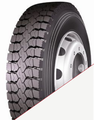
LongMarch LM 302