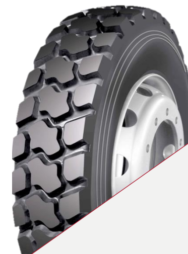
LongMarch LM 301